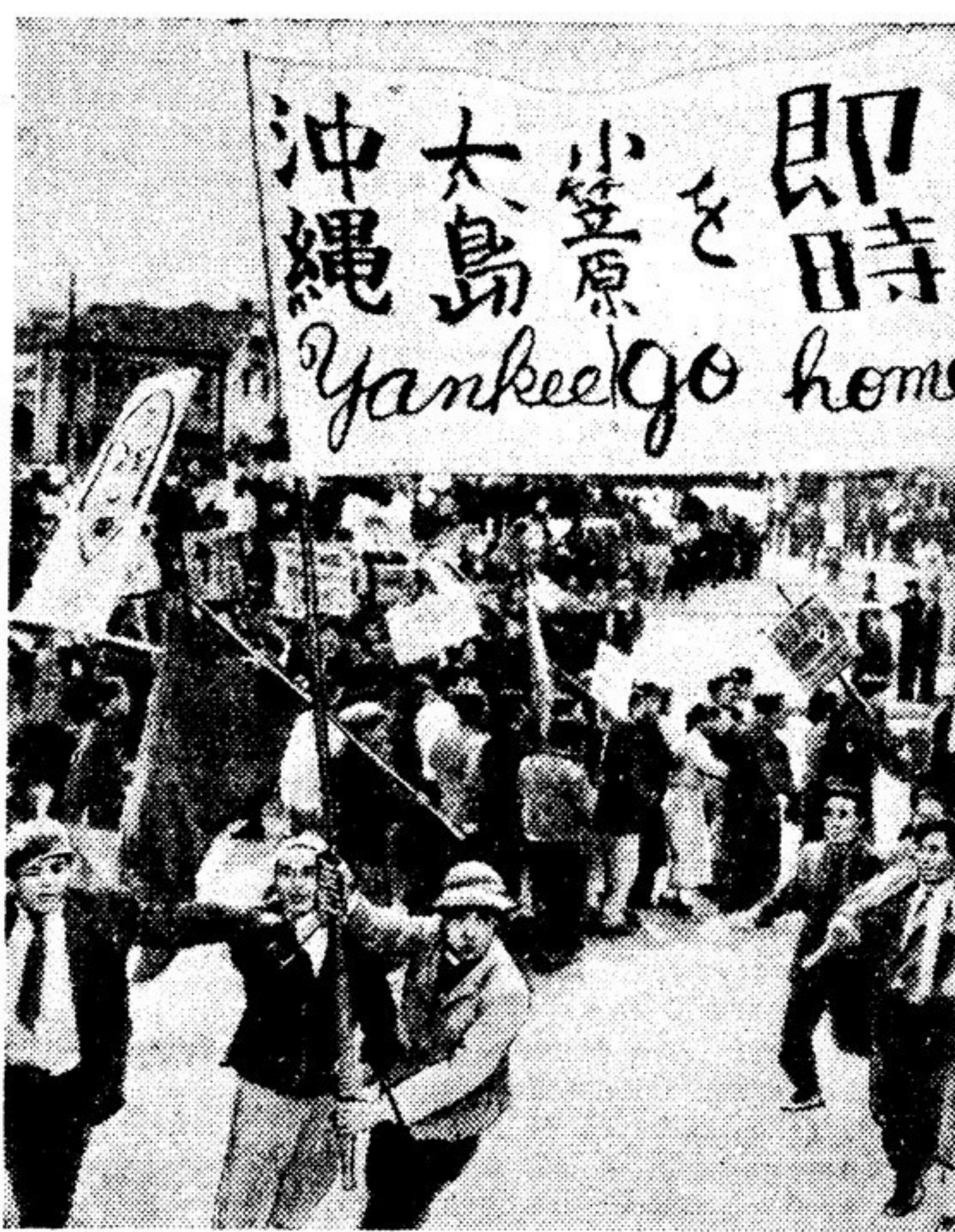
Демонстрация трудящихся японской столицы — Токио. Демонстранты несут плакаты, на которых написаны лозунги с требованиями мира и независимости для их родины. На переднем плане плакат с надписью: «Янки, убраться домой!».

Отправив свою делегацию на Конгресс, бразильская общественность отмечает его огромное значение. Газета «Импrensa популяр» указывает, что созыв Конгресса сторонников мира стран Азии и Тихого океана свидетельствует о «возрастающем укреплении всемирного фронта народов всех стран в борьбе против новой мировой войны».